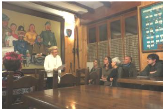
Lettura delle poesie della nostra poetessa