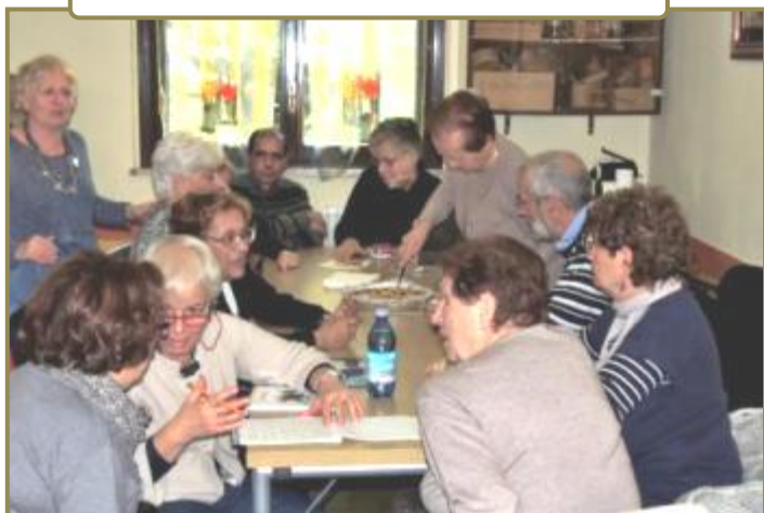
Momento conviviale, pomeriggi letterari