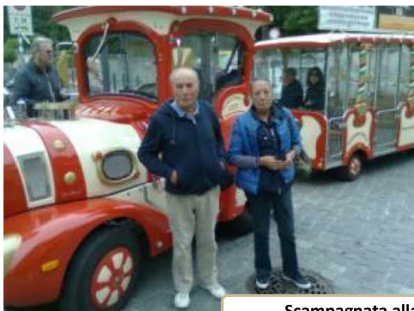
Scampagnata alla Green Way sul lago di Como