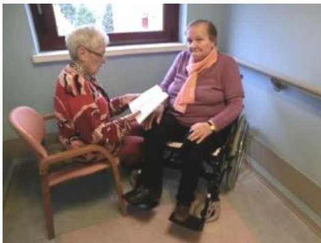
Un caso di compagnia agli anziani alla casa di riposo