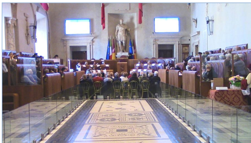
La sala Giulio Cesare in Campidoglio e le Banche del Tempo