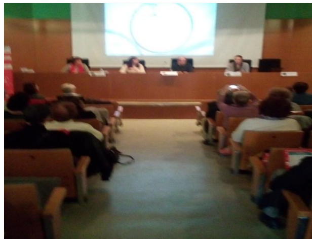
Un momento del Convegno di Santa Coloma di Gramenet a Barcellona