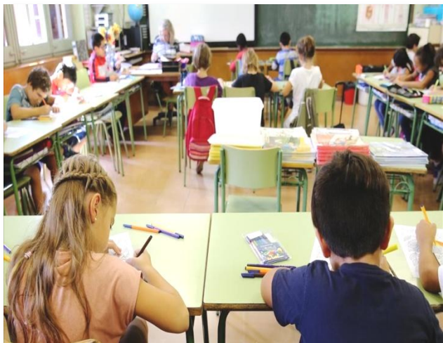
Le informazioni e le fotografie degli eventi si possono trovare sul sito ufficiale dell'Associazione "Salute e Famiglia" di Barcellona

Dirigente Generale dell'Associazione Salute e Famiglia